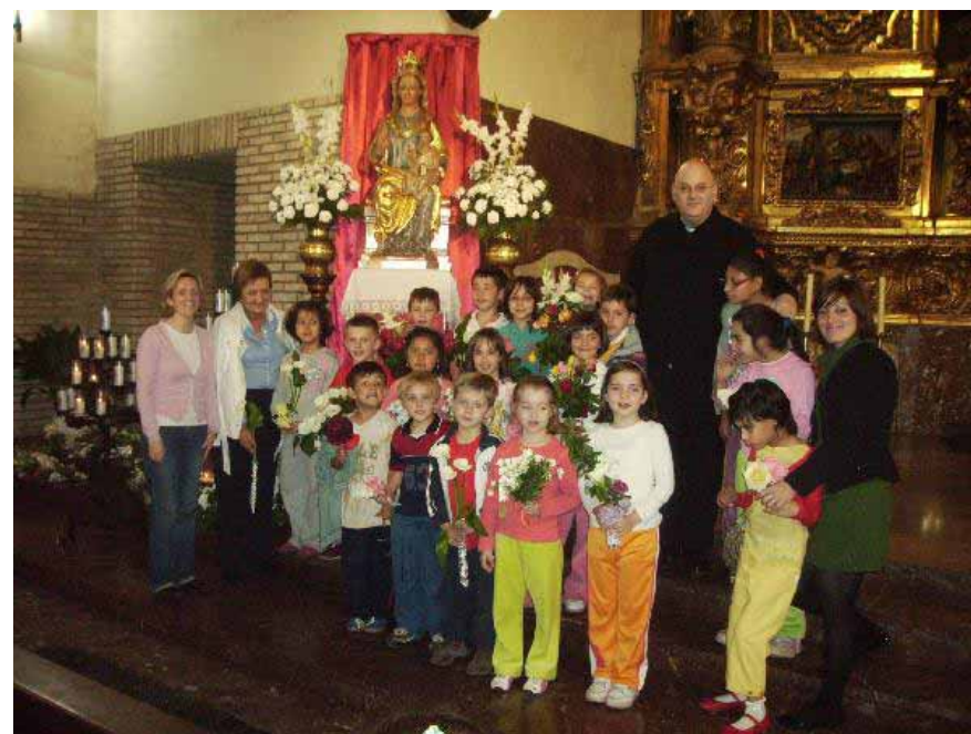
Niños del colegio Francisco Arbeloa ofreciendo flores a la Virgen del Olmo en el mes de Mayo.