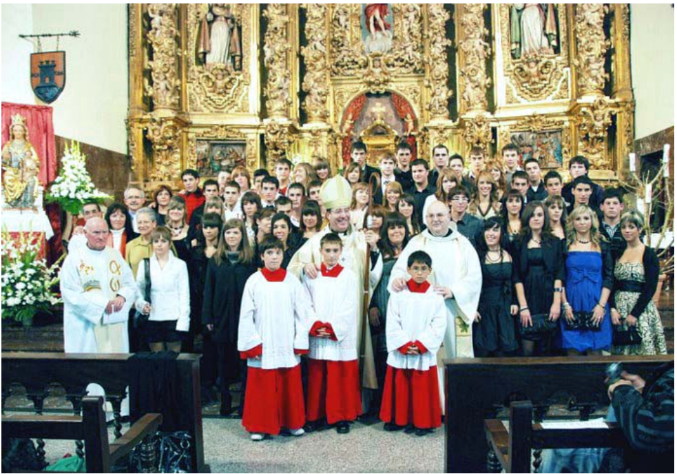
52 jóvenes confirmados en el 2008, catequistas, Párrocos de Azagra, San Adrián y Calahorra y monaguillos con el Sr. Obispo el día de su confirmación.