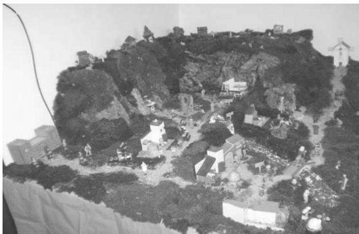
Belén infantil, ganador en la Navidad del 2007

Habrà tres categorías: Belenes Familiares, Belenes Infantiles, Belenes públicos (instituciones, comercios).