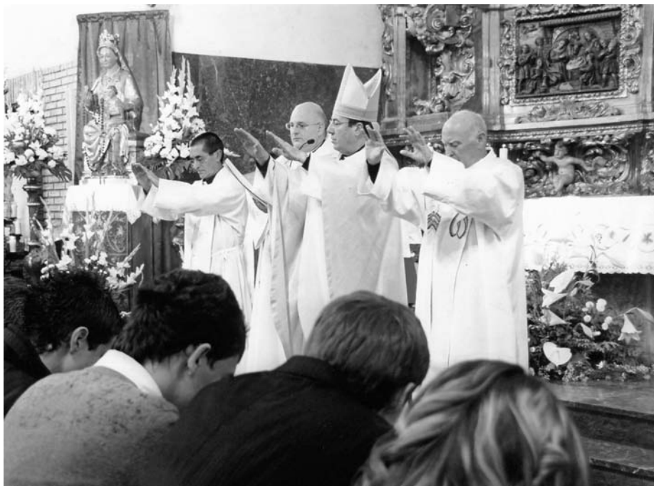
Bendición del Sr. Obispo, Párrocos de San Adrián, Calahorra y Azagra a los jóvenes.